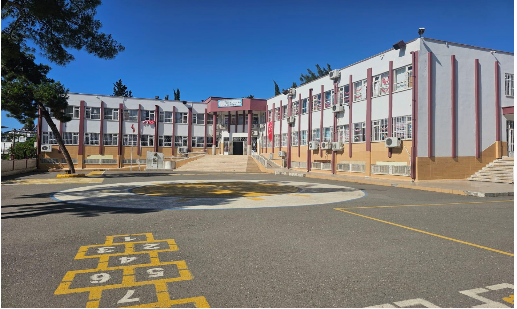
Okulumuzun Dış Görünüőü